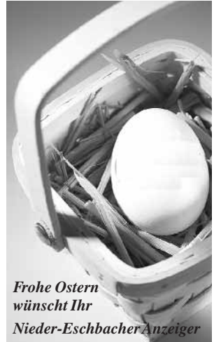
Frohe Ostern wünscht Ihr Nieder-Eschbacher Anzeiger